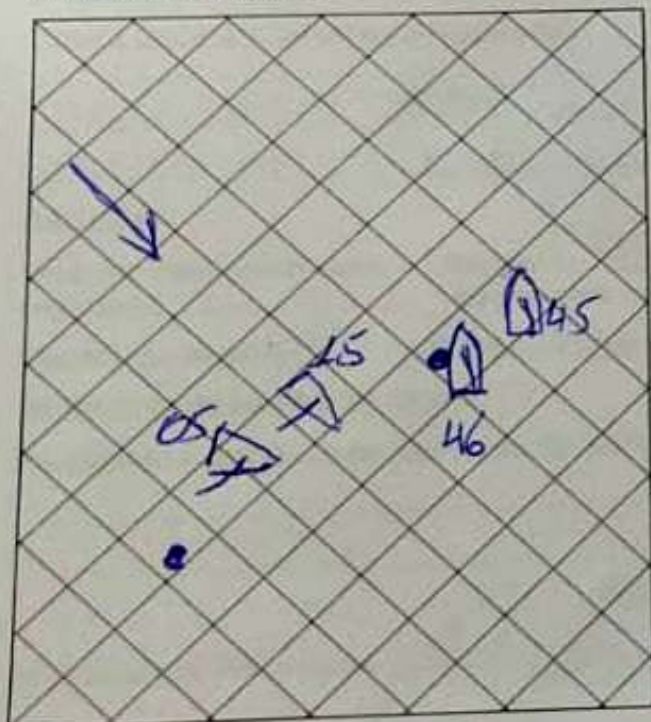
Diagrama: um quadrado = um comprimento de casco mostre posições dos barcos, vento, corrente e marcas de percurso.

Montagem de boia de sotavento, o barco frota 46, ao montar a marca, bateu na boia com a lateral do barco (bombardeio). Foi avisado no ato do protesto mas decidiu não fixar a penalidade